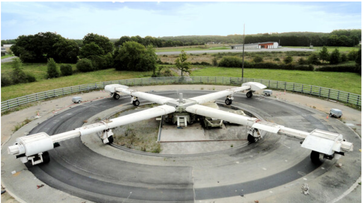
Figure 2 Le manège de fatigue de l'université Gustave Eiffel, un des plus grands simulateurs de trafic au monde, à Bouguenais.

Dans le cadre du projet CADILLAC une base de données a été consolidée à partir de nombreuses données produites lors d'essais menés avec le manège de fatigue (Figure 2) sur le campus de Nantes de l'université Gustave Eiffel, ainsi que sur des expérimentations menées au Service Technique de l'Aviation Civil - STAC (Belmokhtar et al., 2026).